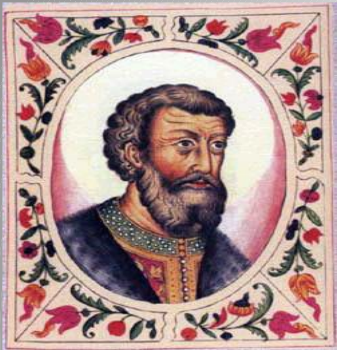
Василий II Темный