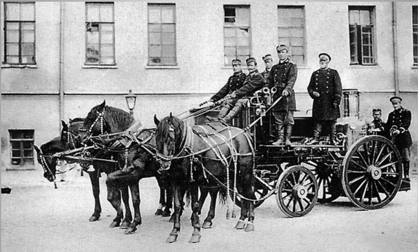
Пожарная охрана. Москва, 1900 год.

Научно-техническая мысль в России всегда отличалась смелостью поиска и оригинальностью решений. Так, именно в России был впервые разработан и испытан ручной пенный огнетушитель.