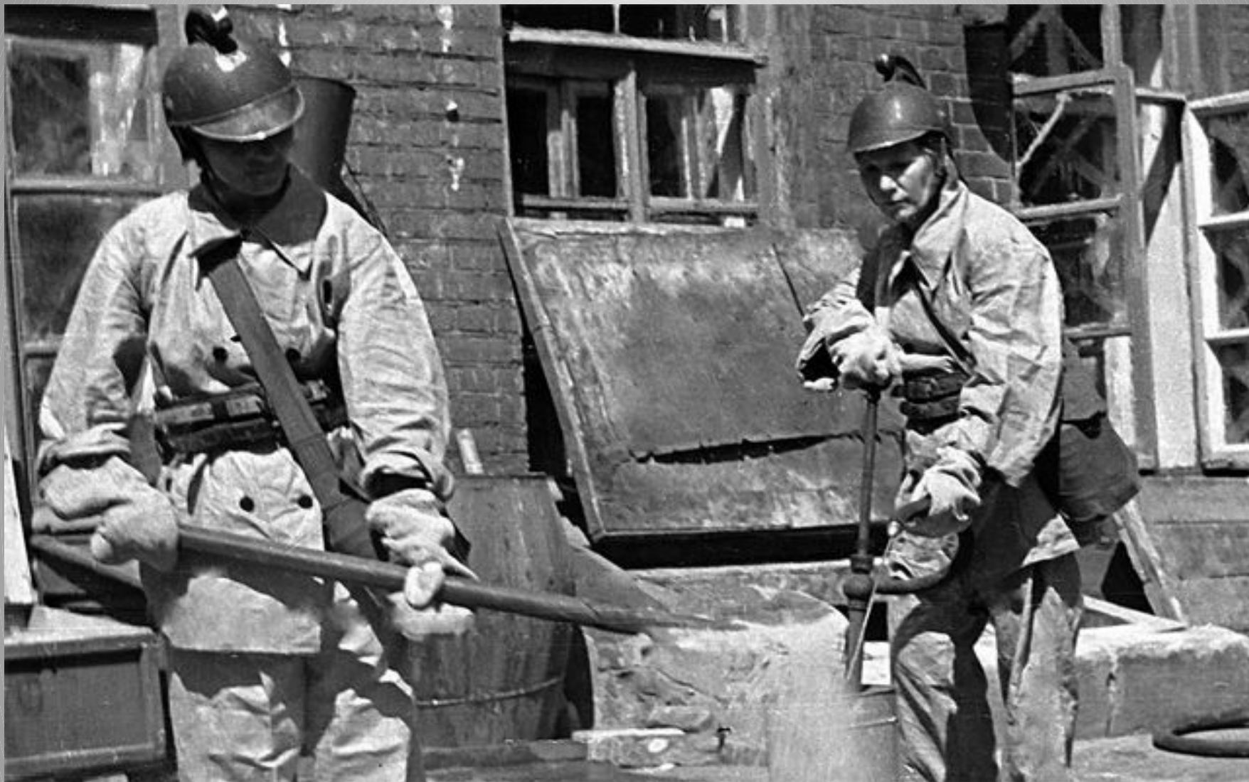
Пожарный расчёт. Москва, 1941 год.