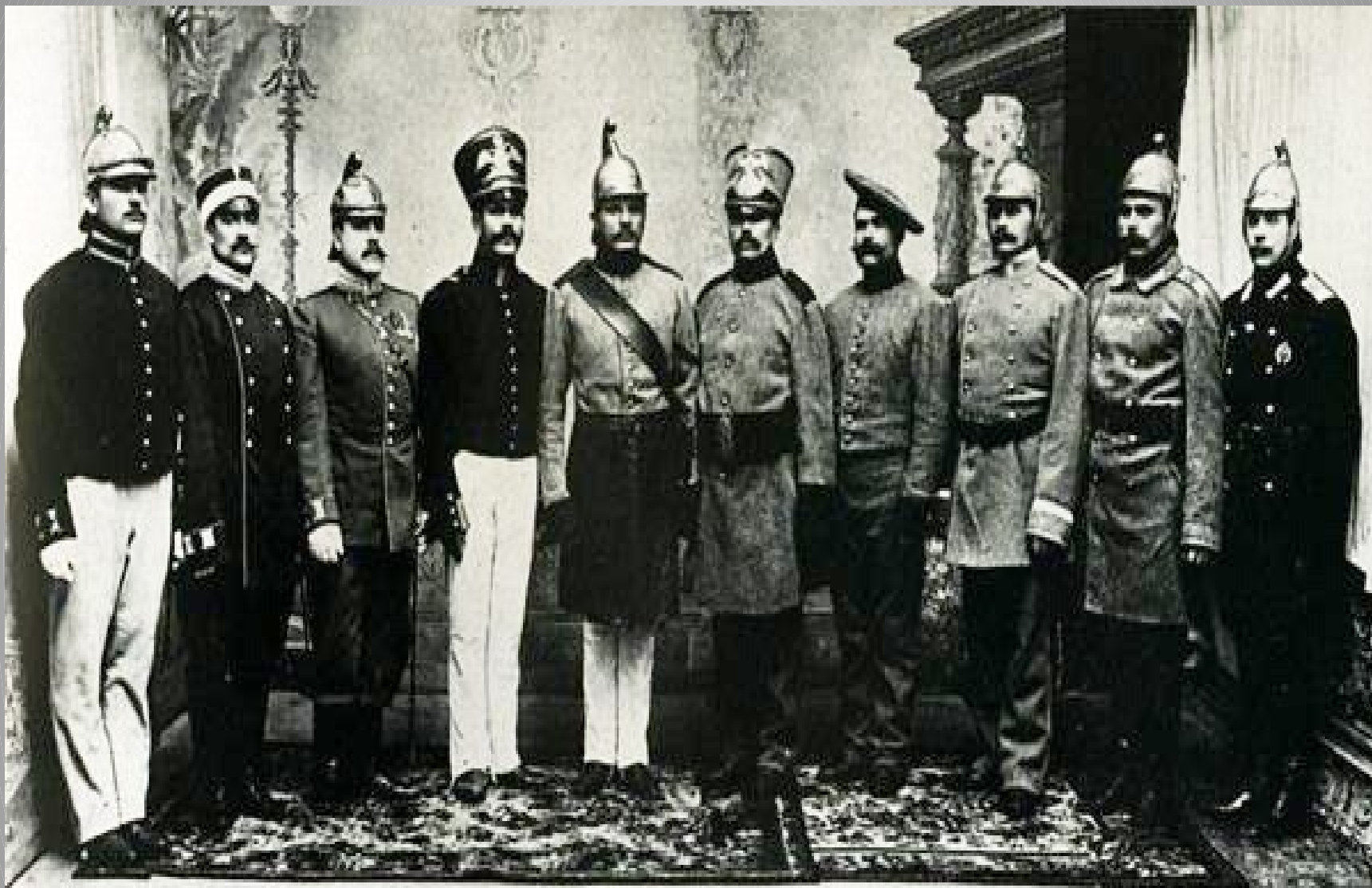
Пожарные Российской Империи в форме разных времён. 1903 год.